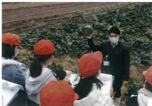
サボイキャベツ見学