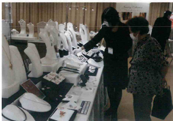
ふれあいレディス展