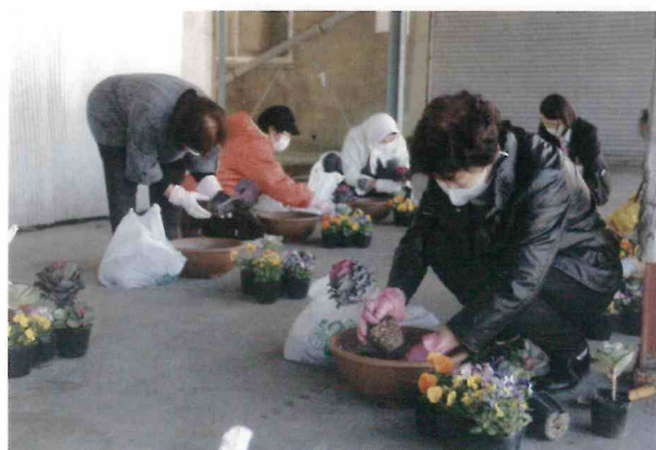
女性部 ガーデニング教室