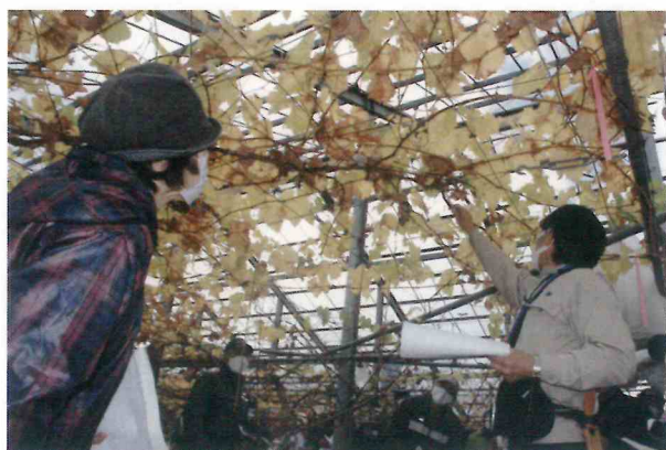
ブドウ剪定講習会

債務者の財政状態及び経営成績に特に問題がないものとして、上記に掲げる債権以外のものに区分される債権をいいます。