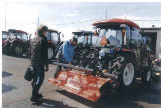
農機自燃部 総合展示会

(注) 農地利用集積円滑化事業と農地中間管理事業を合わせて「農用地利用調整事業」と表示しています。