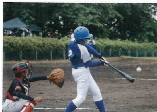
第18回組合長旗争奪スポーツ少年野球大会