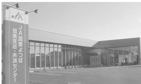
加美支店・共済センターオープン